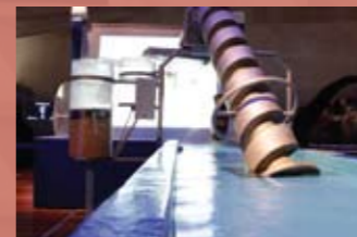
Sala del Agua