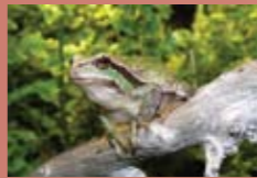
Acuarios Casa del Río