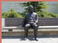
Estatua de Einstein