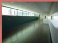
Sala de Usos Múltiples