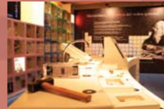
Sala 'La Química a escena'