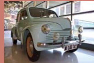
Renault 4 CV