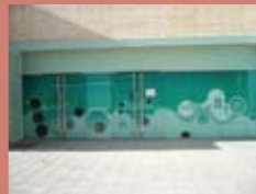
Entrada Casa del Río

*Reservas para grupos con 15 días de antelación. Para realizar una reserva puede ponerse en contacto con nosotros en el número de teléfono 983 144 300, de martes a domingo, de 10.00 a 18.00 h.