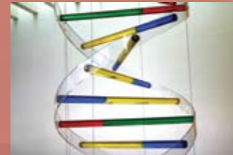
Molécula de ADN