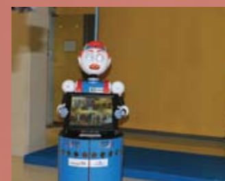
Robot guía Tito.2

Nuestro renovado robot guía te presenta los principales módulos del vestíbulo y el resto de nuestra oferta, además de contarte chistes e informarte de nuestras actividades.