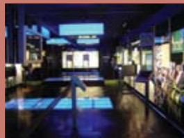
Espacio 41º 4º